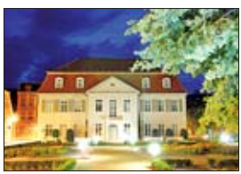
Das Haus liegt gegenüber dem Schloss der Stadt

da man für die deutsche Sprache fast den Notstand ausrufen muss. Deformiert durch unsinnige Rechtschreibreformen, zurückgedrängt durch Anglizismen, immer wieder entzweit durch den floskelhaften Gebrauch, den Politiker, „Talkmaster“ und andere Fernsehgrößen von ihr machen, braucht die deutsche Sprache tatsächlich einen „Ort der Kräftigung“, wie NFG-Vorstandsmitglied Thomas Paulwitz betont. Der ist nun in Köthen geschaffen. Und im nahen Bad Lauchstädt steigt am 17. Oktober das Festival der deutschen Sprache. Noch ist das Deutsche nicht verloren!